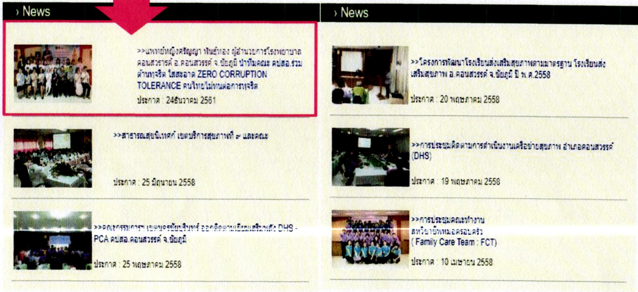
รายงานข่าวโรงเรียนเกี่ยวกับการปฏิบัติงานหรือการดำเนินงานของหน่วยงาน